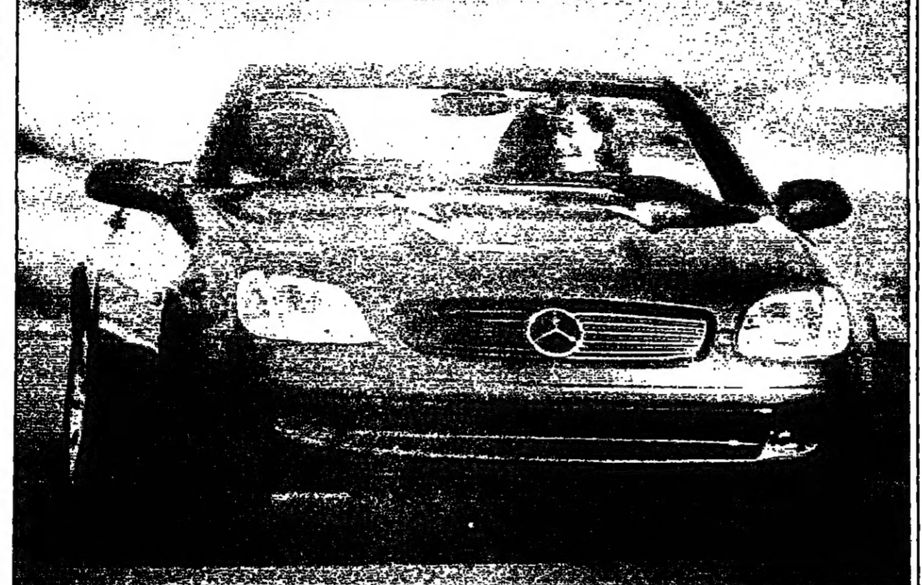
معرض سيارة مرسيدس S-Class التي اختيرت للاتين سيارة العام في الولايات المتحدة خلال معرضها الدولي للسيارات (رويترز)

الكويت - رويترز: قالت وكالة الأنباء الكويتية الرسمية أمس الثلاثاء إن بنك الكويت المركزي سمح لبنك الخليج بشراء ما لا يزيد عن عشرة في المئة من أسهمه بما لا يزيد عن 25 مليون دينار (83.6 مليون دولار) خلال ستة أشهر.